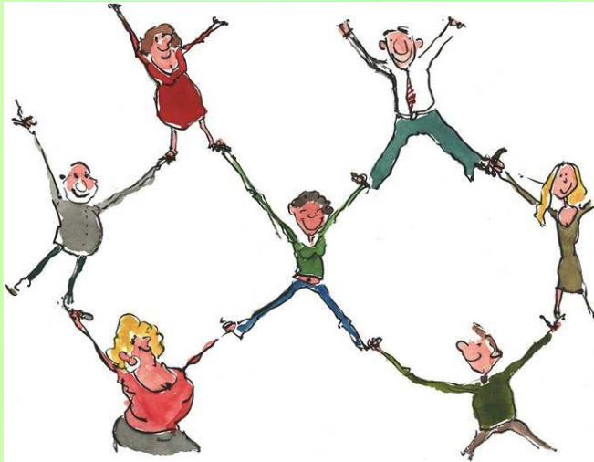
Conferenza di servizio 13 ottobre 2015